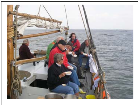
Østerstur i august 2006.