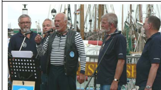
Shantykoret på Havnen i Büsum