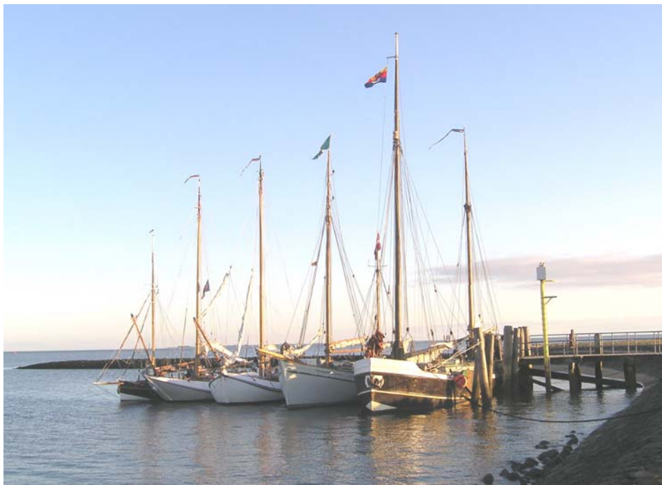
Grøde Appelland, Juli 2008

14. februar rundholter og master afvaskning af sværd, master og rundholter.