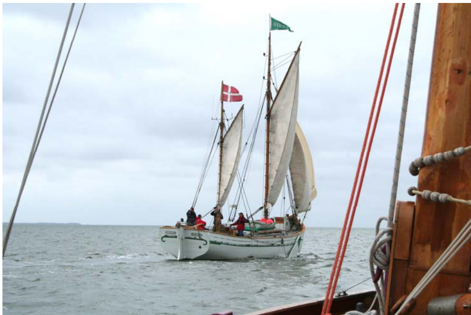
Rebekka nord om Amrum juli 2008

Vi vil hermed opfordre foreningens medlemmer til at meddele adresseændringer, da det er ærgerligt og bekosteligt at modtage nyhedsbreve retur, samt derved at miste kontakten til trofaste medlemmer gennem mange år.