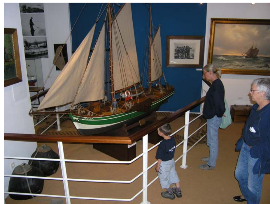
model af evert med klyver på søfartsmuseet i Husum, 2004.

Mød op og deltag, vi plejer at få gennemført arbejdet i hyggeligt samvær.