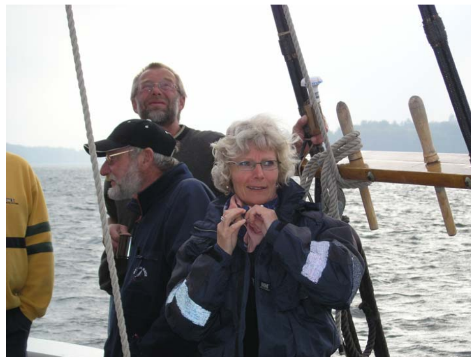
Fra gæstesejls med "Grønne Erna" på Kolding fjord 2004.

Hermed en opfordring til deltagerne om fremsendelse af indlæg til næste Rebekka Nyhedsbrev.